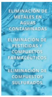
TRATAMIENTO DE AGUAS